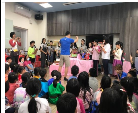
直笛隊演奏童謠曲:小乖乖