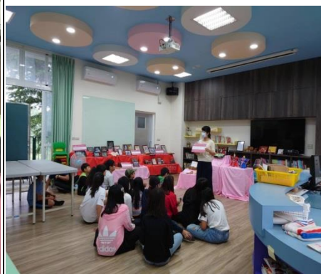
導師利用閱讀課帶學生看展