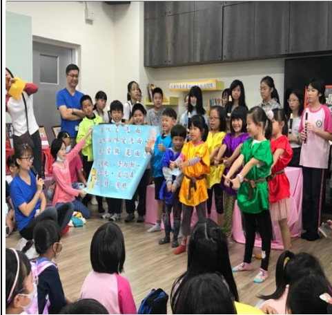
二年級生表演閩南語課文:貓咪愛吃飯