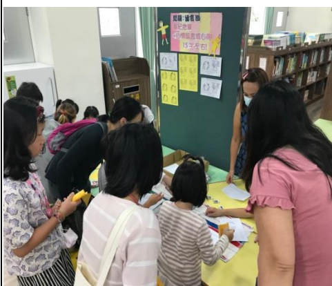
家長與學生對蓋章很有興趣