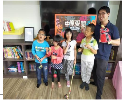
特教班老師與學生合影