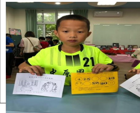
學生填寫學習回饋單